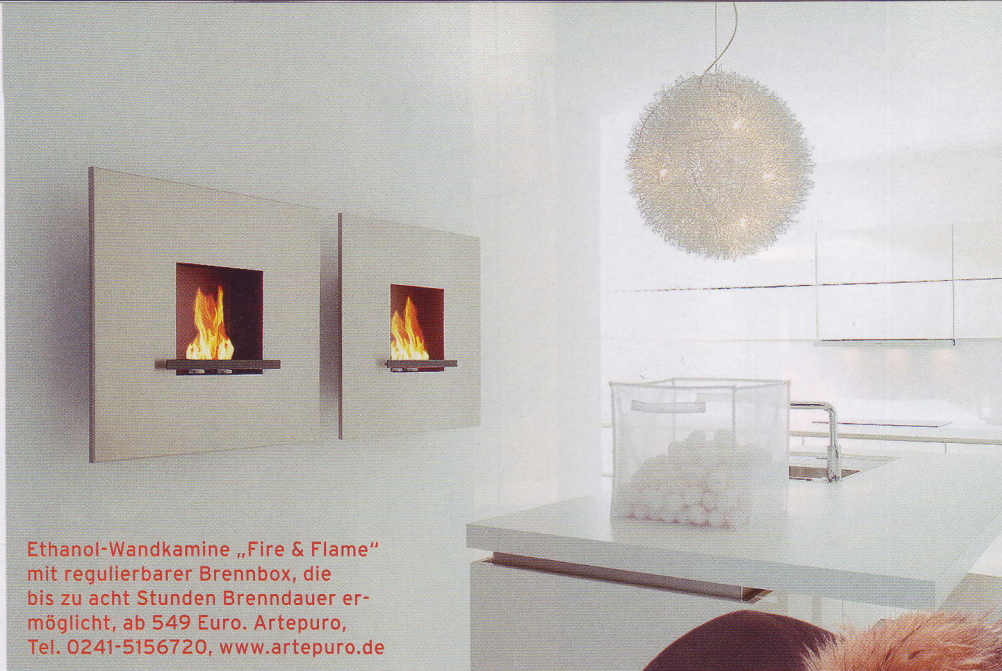
Ethanol-Wandkamine „Fire & Flame“ mit regulierbarer Brennbox, die bis zu acht Stunden Brenndauer ermöglicht, ab 549 Euro. Artepuro, Tel. 0241-5156720, www.artepuro.de