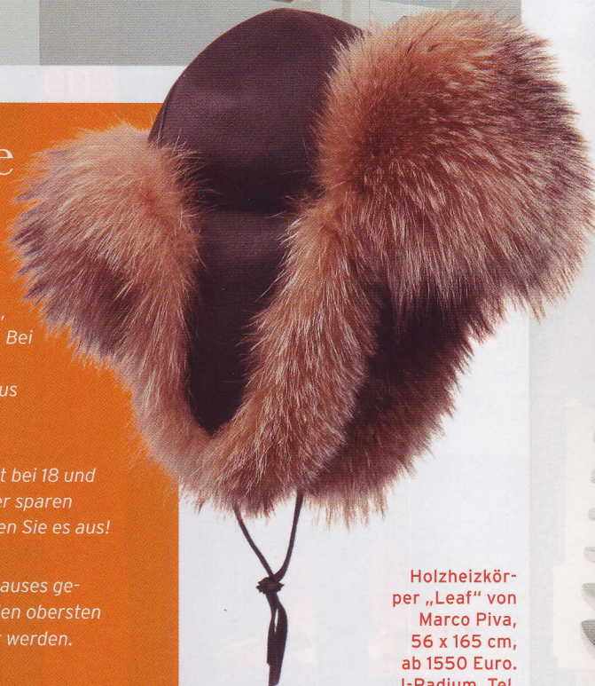
Chapeau „Tsar“ aus Hirschleder und Fuchsfell, 6330 Euro. Hermès, Tel. 089-5521530, www.hermes.com