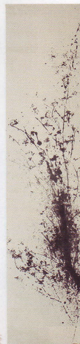
Heizkörper „Velvet“ aus der Kollektion „Pièce Unique“ 220 x 50 cm, Preis auf Anfrage. Atelier Cinier, über Bemm, Tel. 05121-9300391, www.cinier.com