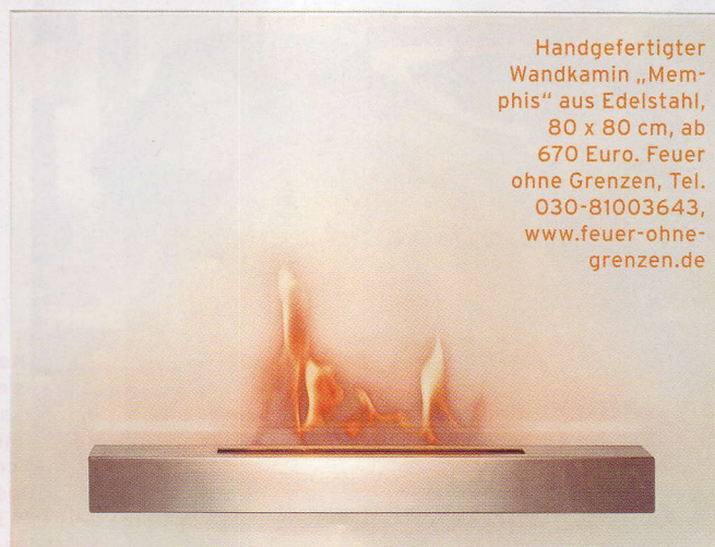
Handgefertigter Wandkamin „Memphis“ aus Edelstahl, 80 x 80 cm, ab 670 Euro. Feuer ohne Grenzen, Tel. 030-81003643, www.feuer-ohne-grenzen.de