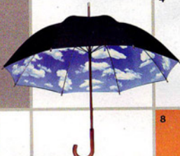
3 TREND: Optimismus. Spaß-Schirm à la Magritte.